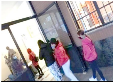
I nostri ragazzi entrano in fila per iniziare l'incontro di catechesi