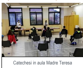
Catechesi in aula Madre Teresa